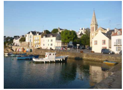
Belle-île - Sauzon